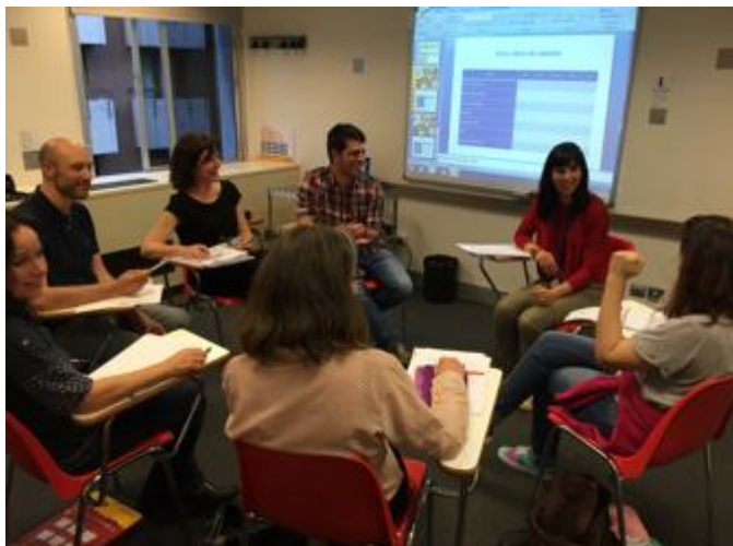
Imagen 1. Curso extensivo comentando sus clases prácticas

Principio 6. Establecer vínculos con el mundo real de la enseñanza: el aula, la sala de profesores, el centro educativo, etc.